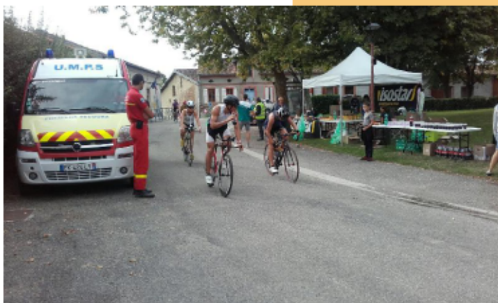
Ravitaillement et poste de secours

« Le Triathlon de Toulouse » connu sous l'acronyme « TdT » a voulu marqué le coup pour ses 10 ans d'existence en organisant l'OccitaMan,