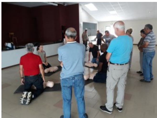
Massage cardiaque sur mannequin

Des diplômes attestant la formation ont été remis à chaque participant