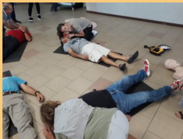
Formation au défibrillateur

NB : La simulation en vraie grandeur de la gestion d'un « risque » survenu à Sabonnères, initialement prévu le 5 Octobre 2020 est reportée au samedi 29 Février 2020 ou au samedi 7 Mars 2020