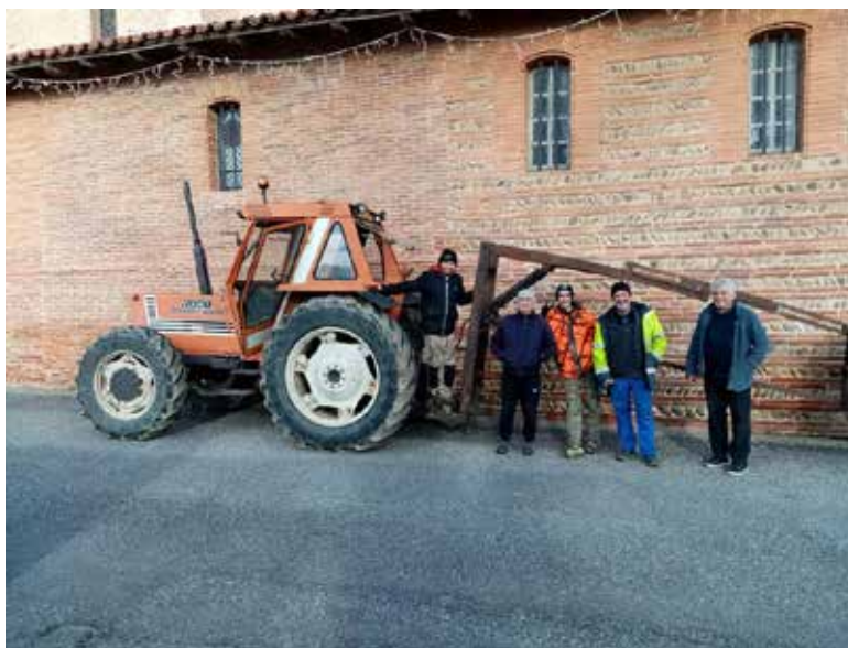
Installation dans la bonne humeur !