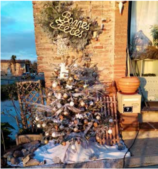
CONCOURS DE SAPIN BRAVO à la famille Lafaye pour ce magnifique sapin.